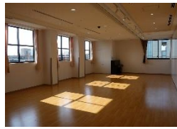
集会室 B [80㎡]