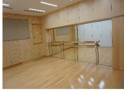
多目的ルーム B [38㎡]