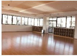
集会室 A [120㎡]