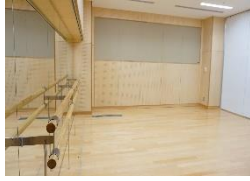
多目的ルーム A [42㎡]